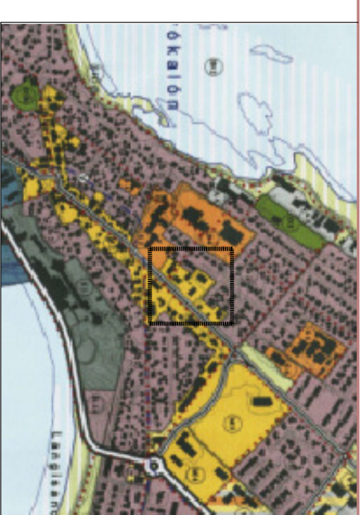
Hluti Aðalskipulags Akraness 2005-2017